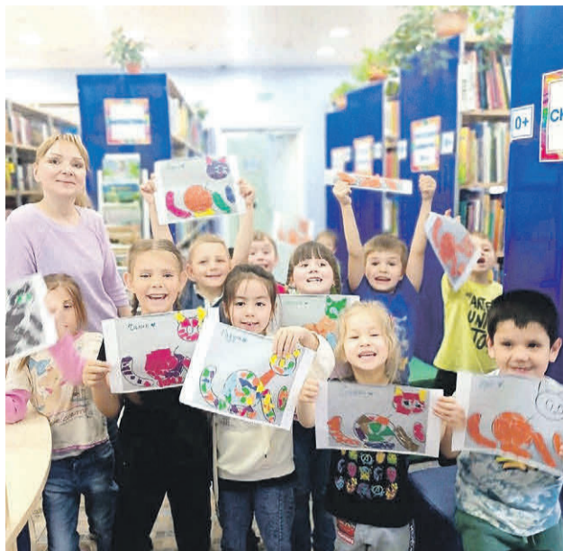
В Международный день головоломок ребята узнали в чем секрет одной из самых популярных

Ко Дню семьи, любви и верности, 8 июля состоялась творческая мастерская «Счастливы вместе». Дошколятам рассказали о Дне семьи, любви и верности. О муромском князе Петре и его жене Февронии, о символе праздника – ромашке. В конце мероприятия ребята нарисовали свои семьи. Чудесные детские рисунки всё лето будут радовать наших посетителей!