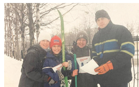
Коллектив ПМК «Ленинградец»